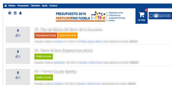
Listado de propuestas en página principal

Para seleccionar propuestas, pincha en los botones "Añadir a la cesta" que aparecen junto a las distintas propuestas. Cada vez que selecciones una propuesta se añadirá a la cesta de propuestas seleccionadas y en la propuesta seleccionada aparecerán dos botones con los textos "Propuesta en la cesta" y "Quitar de la cesta". Además el número total de propuestas que tienes seleccionadas aparecerán reflejadas con un número en la cesta de la cabecera.