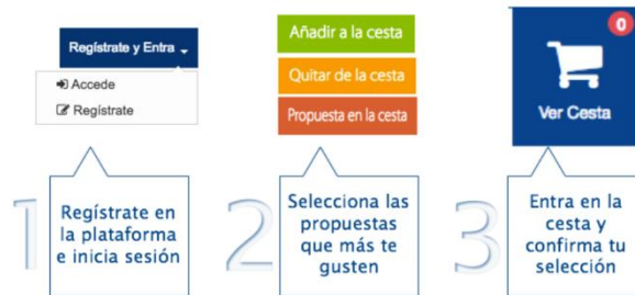
Pasos para votar de manera on-line

Puedes votar en esta fase de propuestas finalistas de alguna de las dos formas siguientes: bien de manera on-line en esta plataforma o presencialmente acercándote al Ayuntamiento. Pero recuerda que tan solo podrás votar una sola vez.