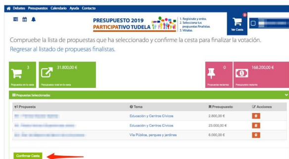
Botón de confirmación de la cesta

Una vez confirmada la cesta habrás ejercido tu derecho de voto en los presupuestos participativos y no podrás votar de nuevo ni deshacer tu votación.