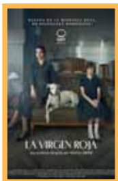
La Virgen Roja (114 min.) Sábado 12: 20:00 - 22:15 h. Domingo 13: 19:45 h. Lunes 14: 17:45 - 20:00 h. Martes 15: 17:45 - 20:00 h. Precio: 6,00€