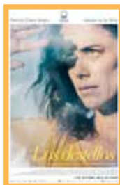
AVANCE NOVIEMBRE Los destellos (101 min.) Domingo 3: 17:45- 19:45 h. Lunes 4: 18:00 - 20:00 h. Martes 5: 20:00 h. Miércoles 6: 18:00 - 20:00 h. Precio: 6,00€