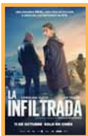
La infiltrada (117 min.) Sábado 19: 17:45 - 20:00 - 22:15 h Domingo 20: 19:45 h. Lunes 21: 17:45 - 20:00 h. Precio: 6,00€