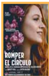
Romper el círculo (130 min.) Martes 1: 20:00 h. Precio: 6,00€