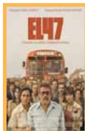
El 47 (110 min.) Sábado 5: 20:00 h - 22:15 h. Domingo 6: 19:45 h. Lunes 7: 18:00 - 20:00 h. Martes 8: 20:00 h. Precio: 6,00€