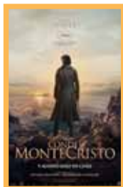
El Conde de Montecristo (178 min.) Martes 1: 17:00 h. Precio: 6,00€